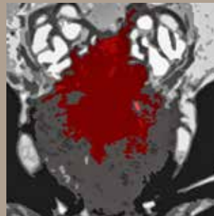
Modul C: Staging | AS