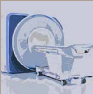
Modul A: Technik